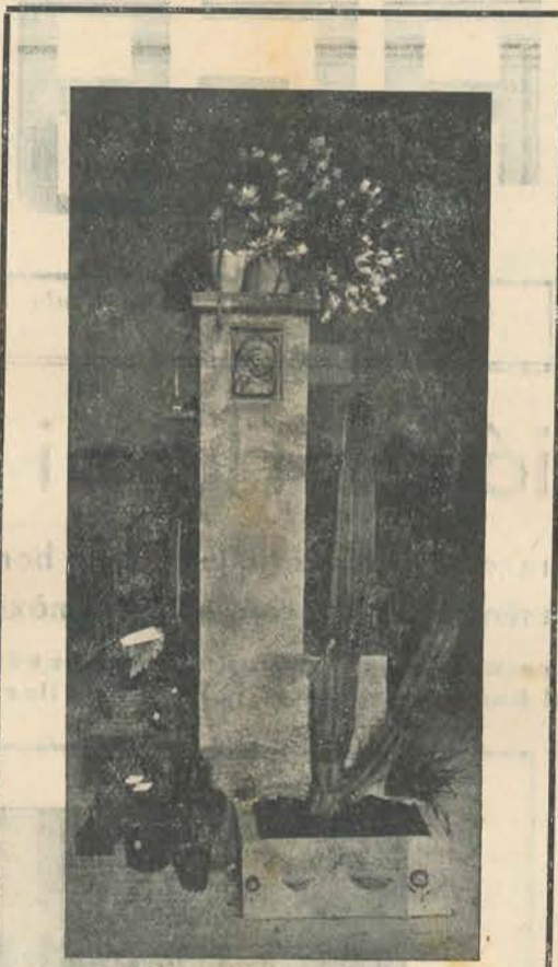
Tots els visitants trobaran molt lògic que el fotògraf quedés meravellat d'aquest escaient fragment de l'Exposició que molt bé podria ésser arrancat d'un encisador jardí.

El nombre de plantes que integraven l'Exposició, pot indicar-se en unes mil dues-centes. I entre elles les que predominaven més eren: Com a planta de moda els cactus, seguint les delicades bogònies roses, vermelles i blanques, les pures hortències, les perfumades clavellines gegant de Niça, merla granate i gardènia blanques. Les vermelles magent plumes de Santa Teresa, i les de color de rosa, les eixerides margaridoies, la bogonia reig de gran fulla decorativa, el gerani japonès, platejat i comú, les fúccies amb els seus penjolls d'arrecades morades, i