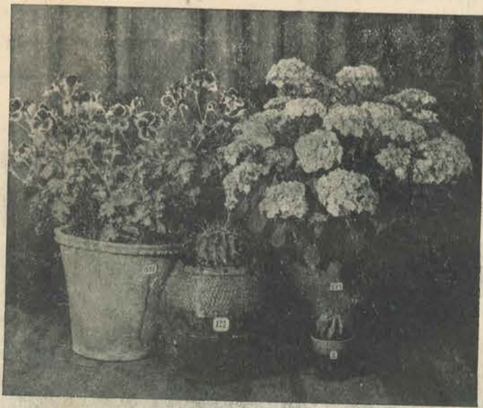
Una hortència, un gerani i dos cactus, foren els que es disputaren més aferrissadament el premi, resultant vencedora l'hortència, no per la seva corpulència, sinó—que a jut dels votants—per la seva bellesa. Passada la lluita electoral les quatre plantes amb estreta cordialitat es deixen fotografiar per tal de fer perdurar la seva amistat.