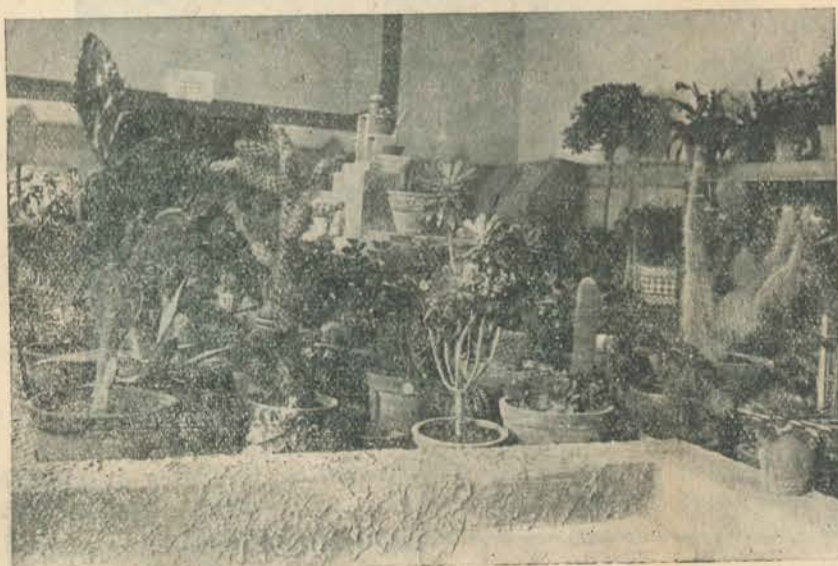
L'ull de l'objectiu no tem les ferides i de ben aprop logra un evocador tema